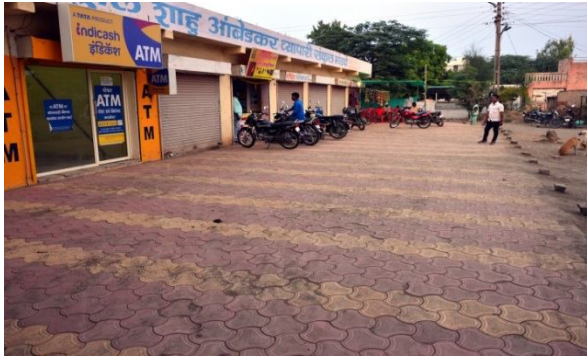
चित्र . २. मांडवे मधील व्यावसाय / उद्योग